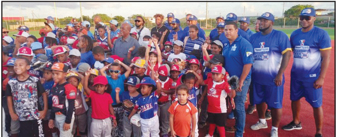
E portrètnan ta ilustrá apertura di e promé edishon di ‘Bonaire Baseball Week’.

di peloteran lokal, en partikular muchanan ku ta konsider’è komo un ehèmpel pa nan futuro karera den deporte di beisbòl. El a marka historia, ya ku e ta forma parti di e úniko duo di tata i yu ku a logra konkistá e kopa di kampion di homerun di Liga Mayó di Beisbòl.